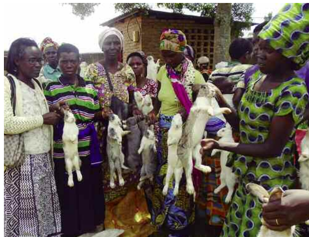
Untxien banaketa UGAMA elkartearekin. ]

Malnutrizioaren aurkako borrokaren helburuak lortzeko, indartu egin dira onuradunek dieta orekatu bat prestatzeko gaitasunak, sukaldetan erakusketak eginez eta mobilizazioak burutuz. Ekintza horiei esker, agerikoa da familia onuradunetan izan duen inpaktu positiboa.