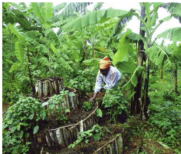
Ortuak sortu dira malnutrizioa duten haurren etxeetan. ]