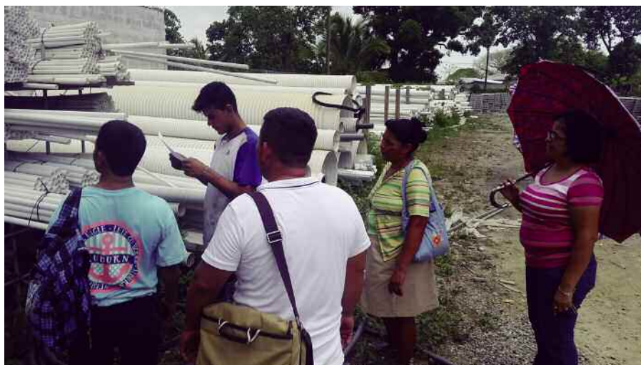
Comité de Compra integrado por CCO, Iglesia Católica y la comunidad, verificando la calidad de los materiales. ]

Por último, se pretende fortalecer las capacidades de las personas responsables de las infraestructuras de agua y saneamiento en cada comunidad. Para ello, se va