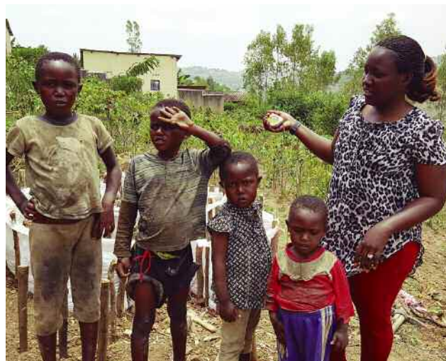
Proiektuan parte hartu duten haurrak eta ARDE teknikaria. ]