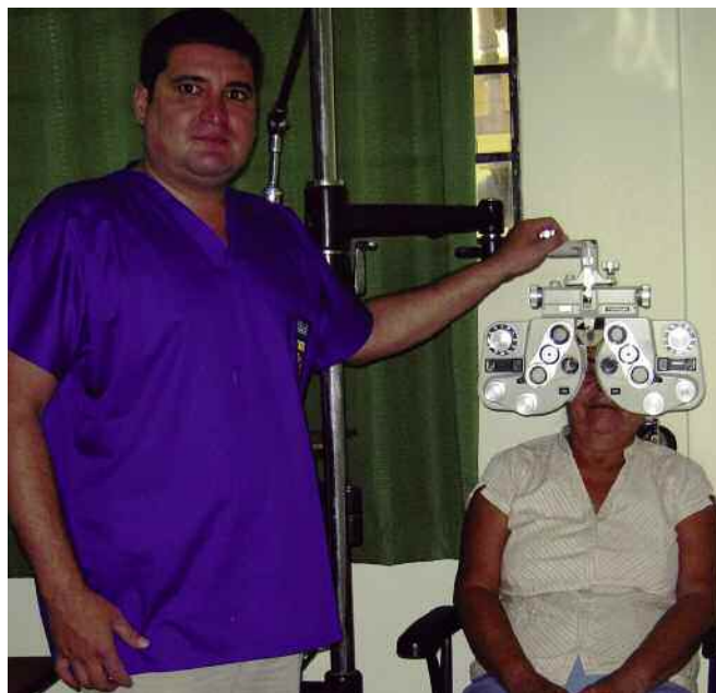
Revisión en la clínica oftalmológica a una mujer de la comunidad. ]

necesidad básica. Por otro lado, seguiremos caminando hacia la autosostenibilidad progresiva de la clínica oftalmológica, siempre desde parámetros de equidad, justicia y solidaridad.