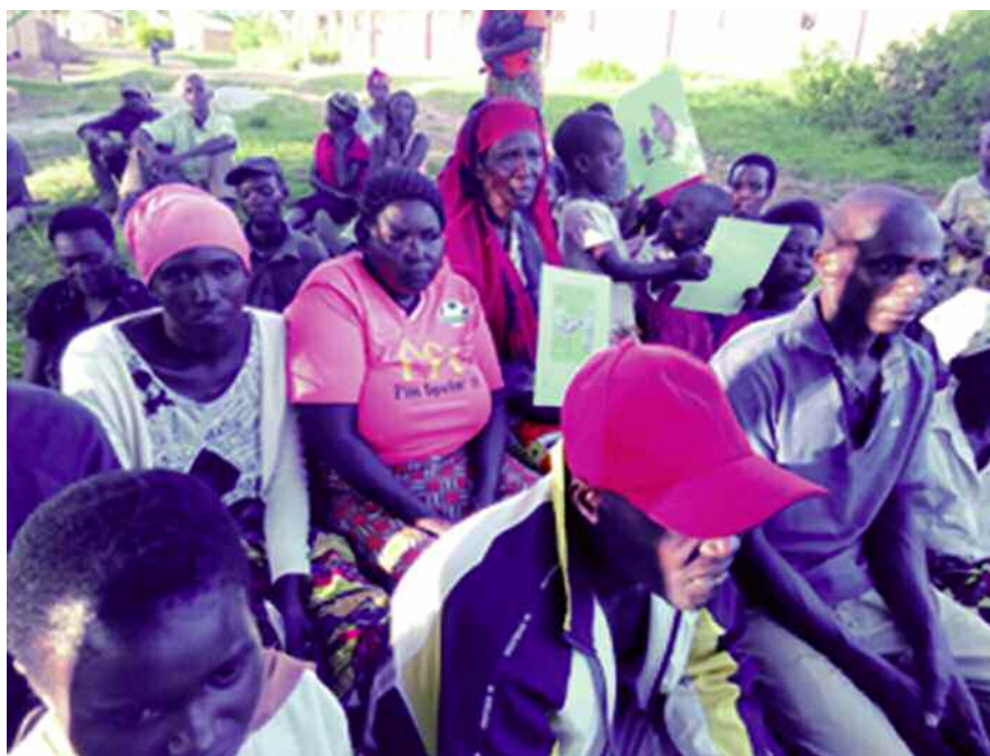
En la aldea de Kibaya, Ruanda, miembros del Club de Higiene durante una formación con LE LAVAGE DES MAINS. ]