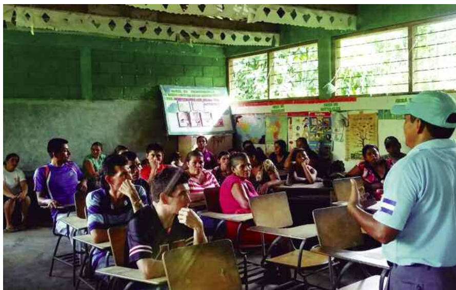
Socialización del proyecto con medicusmundi bizkaia y Ayuntamiento de Bilbao en cada comunidad beneficiaria (Foto: CCO). ]

bajo de campo se vio claro que cuando hay problemas con el agua, quien más sufre es la mujer, ya que sigue siendo la responsable de la casa. Por lo que, en este proyecto se organizan formaciones a mujeres en cada comunidad, mediante técnicas populares de educación, y se constituyen redes de mujeres. El objetivo es que las mujeres formen parte de la toma de decisiones. Por lo que se toman medidas para ello, mediante la capacitación, presencia y participación.